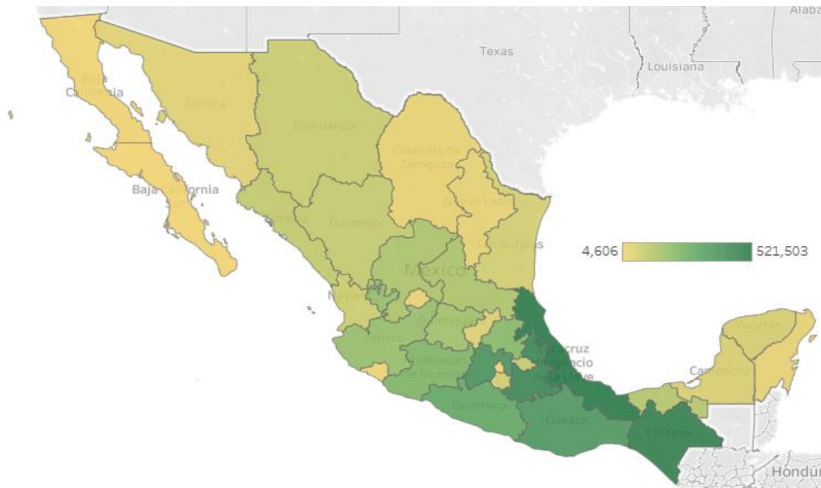
Figura 1 Unidades de producción agropecuaria activas por entidad federativa

La agroindustria representa un importante sector en la economía de México, siendo una considerable fuente de empleos, ingresos y abastecimiento alimentario. Por ello, analizar la distribución y el comportamiento de los niveles de producción resulta fundamental para identificar tendencias, patrones y características relevantes del ámbito agroindustrial. De acuerdo con el Censo Agropecuario de 2022 realizado por el INEGI, en la figura 1 se observa una concentración significativamente mayor de la producción agropecuaria en la región sur del país, en comparación con otras regiones.