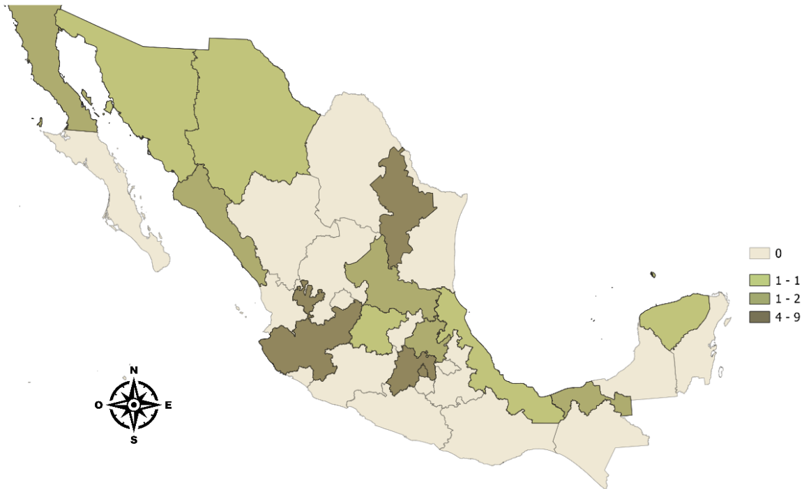
Figura 6 Concentración de Panaderías por estado con 251 y más personas empleadas

Nota. Elaboración propia con datos de INEGI. Directorio Estadístico Nacional de Unidades Económicas (DENUE, 2024).