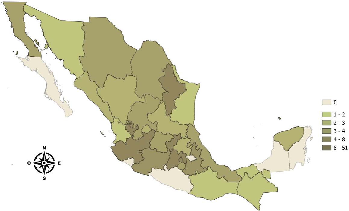
Figura 5 Concentración de Panaderías por estado con 51 a 250 personas

Nota. Elaboración propia con datos de INEGI. Directorio Estadístico Nacional de Unidades Económicas (DENUE, 2024).