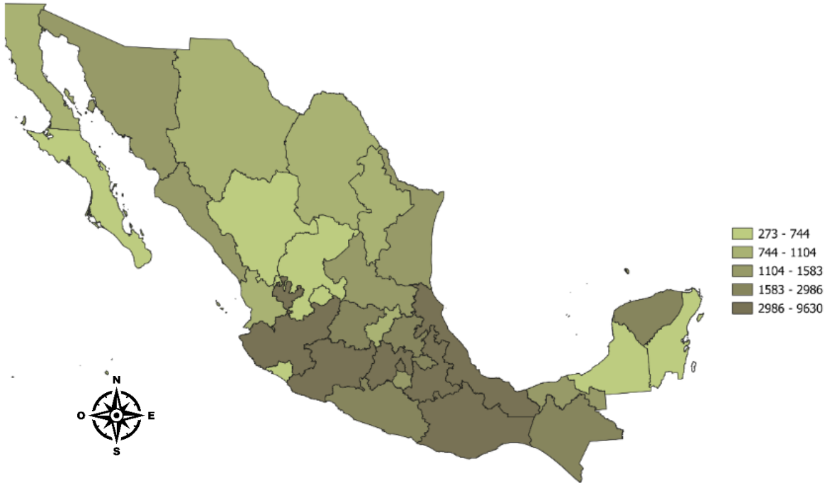
Figura 3 Concentración de Panaderías por estado con 0 a 10 personas empleadas

Nota. Elaboración propia con datos de INEGI. Directorio Estadístico Nacional de Unidades Económicas (DENUE, 2024).