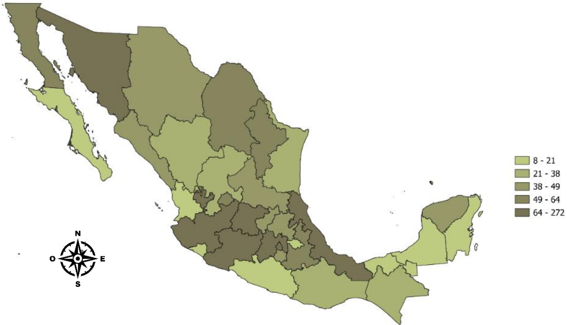
Figura 4 Concentración de Panaderías por estado con 11 a 50 personas empleadas

Nota. Elaboración propia con datos de INEGI. Directorio Estadístico Nacional de Unidades Económicas (DENUE, 2024).